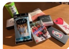
乙女のカバンの中身を拝見

校則があってもおしゃべりを楽しみたいロアさんは「毎朝大変なので、簡単寝グセ直しの方法が知りたい。休日のちょびりメイクなど、美容師さんが講習会を開いてくれたらいいな」と話します。