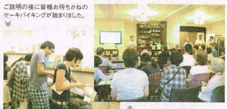
ご説明の後に皆様お待ちかねのケーキバイキングが始まりました。