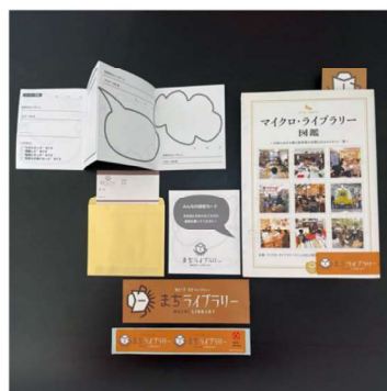
まちライブラリーグッズ 貸出用の本に装備します。ブックポケットには貸出カード、感想カードを入れます。感想カードには最初の紹介の一言を！読んだ方からメッセージが追加されるかも。背シールは、貸出用の本とわかるようにつけていただきます。