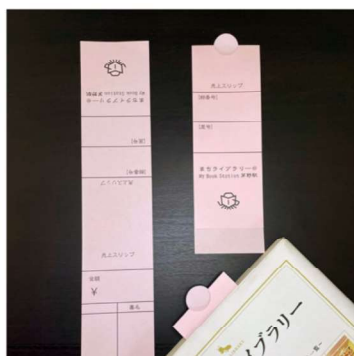
スリップ 販売本に挟み込みます。本の値段、屋号などを記載します。