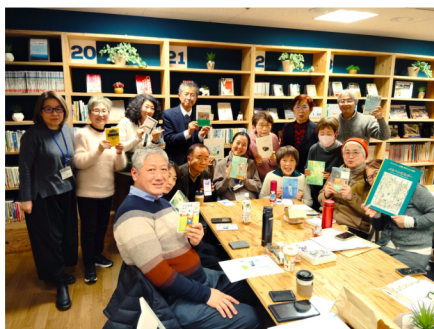
皆さん持ち寄った本を手にパチリ！

移住してきた方や地元の方、お仕事もバラバラな参加者の皆さん。みんなが持参したのは、お弁当と“おすすめの本”。自己紹介とともに本の紹介もしながら、ワイワイガヤガヤ、あっという間に1時間が過ぎていきました。