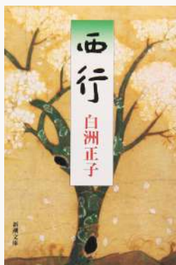
西行 著：白洲 正子