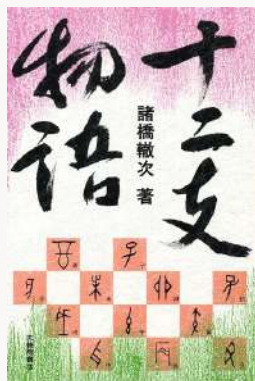
十二支物語 著：諸橋 徹次