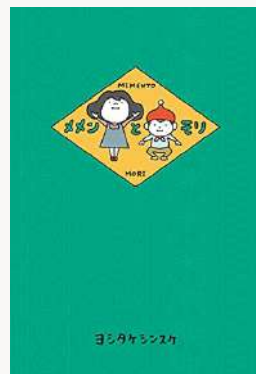
メメンとモリ 著：ヨシタケシンスケ