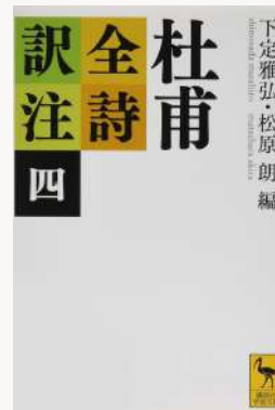
杜甫全詩訳注 四 著：下定 雅弘