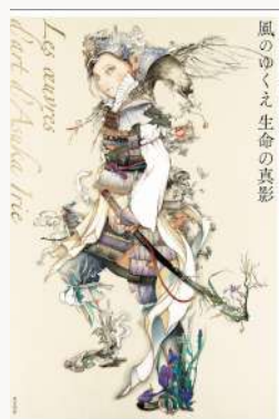
風の中くえ生命の真影 著：入江 明日香