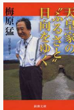
天皇家の “ふるさと”日向をゆく 著：梅原 猛