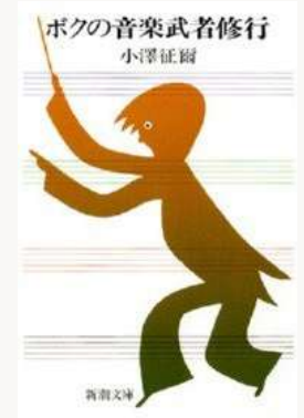
ぼくの音楽部者修行 著：小澤 征爾