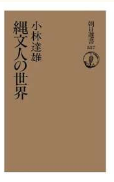
縄文人の世界 著：小林達雄

考古学にはロマンはあるの かないのかという論争をよ くする。 想像よりも、現実にもわかっ ていく難しさを痛感。