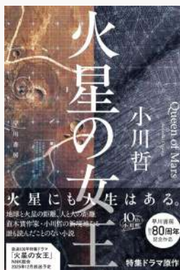
火星の女王 著：小川 哲