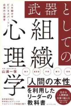
組織心理学 著：山浦一保