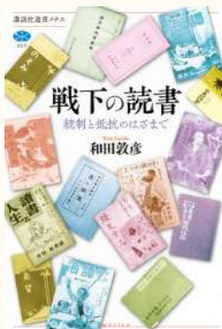
戦下の読書 著：和田敦彦