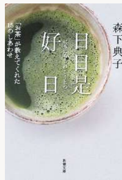
日々是好日 著：森下 典子