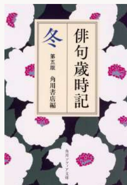
俳句歳時記 著：水原秋櫻子