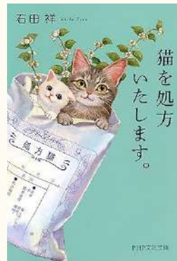
猫を処方いたします 著：石田祥