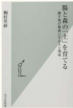
腸と森の「土」を育てる 著：桐村里紗