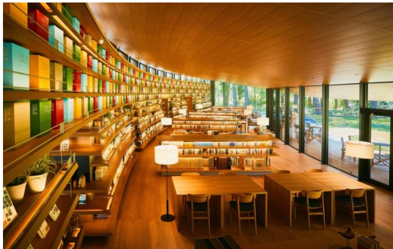
まちライブラリー@MUFG PARK

まちライブラリー ブックフェスタ・ジャパン 2024 実行委員会（実行委員長：大阪公立大学研究推進機構特別教授、橋爪紳也）は、現在開催中の日本中が本でつながる「まちライブラリー ブックフェスタ・ジャパン 2024」の関連企画「マイクロ・ライブラリーサミット」を10月20日（日）にまちライブラリー@MUFG PARK（東京都西東京市）にて開催いたします。